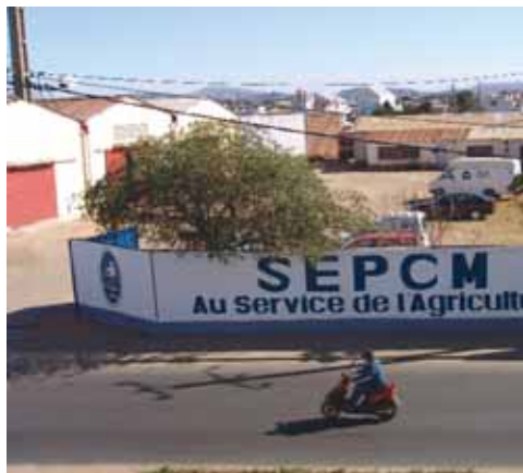
La SEPCM a fait peinture neuve.

Avec l'apparition sur le marché des engrais de ce nouveau produit dont la qualité des matières premières est garantie comme de l'or, les consommateurs-agriculteurs peuvent avoir totalement confiance en nous, une société leader dans la production et la commercialisation des engrais de qualité haute au Vietnam. ➔