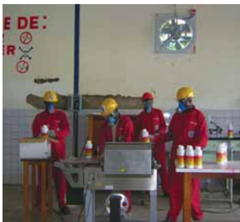
Atelier de préparation des Phytosanitaires.

Dans le triple souci de préserver les acquis, améliorer les conditions de travail et renforcer son