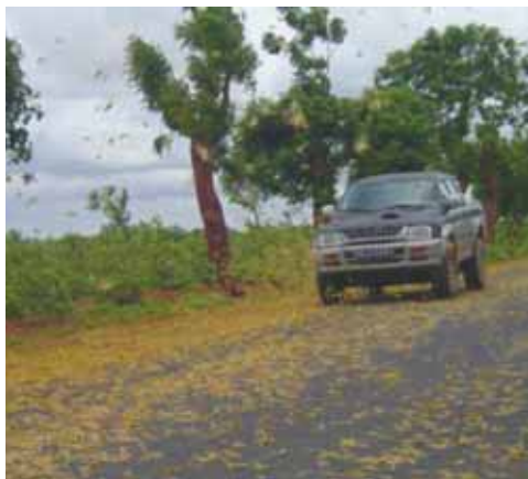
Des criquets par millions sur les routes.

Nous apportons ainsi notre modeste contribution aux transferts de technologie et d'innovation alimentaire.